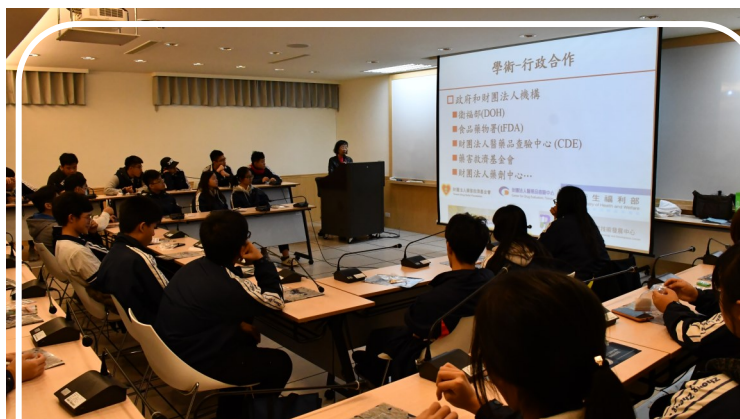
1081204 中正高中學生來訪藥學系