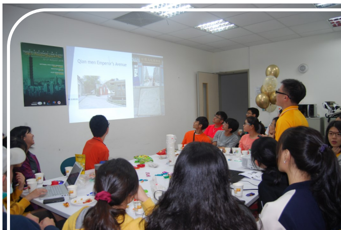
1081206 藥學系 English corner 感恩節 Party